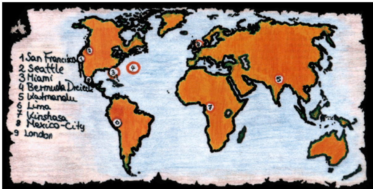
Flughäfen gibt es rund um die Welt

Zak kehrt in die Küche zurück, wo er das trockene Brot in die Spüle legt. Mit Hilfe des Schraubenschlüssels läßt sich das Abflußrohr abdrehen. Er betätigt den Schalter, und vom Brot bleiben nur noch Krumen übrig, die er einsteckt. Das Abflußrohr wird mit dem Schraubenschlüssel wieder in den Originalzustand versetzt und der Schalter ausgeschaltet.