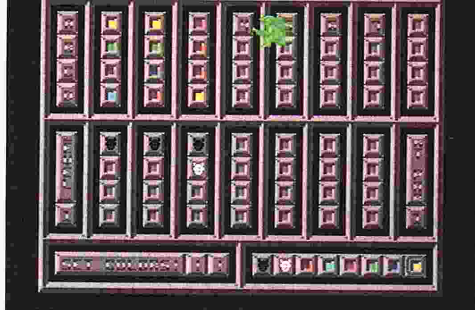
[2] Teuflich grinsen die Dämonenfrazen: Das war wohl nichts!

Auswertung: Für jede erratene Farbe erhält man einen weißen Teufelskopf im Bildschirmteil unterhalb der gewählten Kombination (Abb. 2). Befand sich die Farbe bereits an der